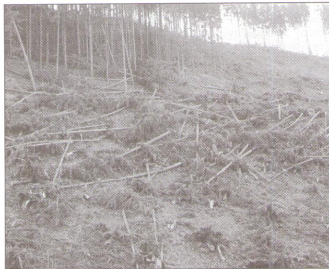
Víchrica v noci z 27. na 28. októbra 2002 spôsobila Zdrúženiu bývalých urbarialistov škody, ktoré zodpovedajú ťažbe za šesť rokov

Babka 2 800 m 3 , Kopanice 200 m 3 , Baba dolina 1300 m 3 , Breh a Sekera 500 m 3 , Rotbach a Glaz 150 m 3 , Kvetnica 2 000 m 3 , Gánovské 200 m 3 , Krompla 350 m 3 . Je potrebné vynaložiť veľké úsilie, aby táto kalamitná drevná hmota bola spracovaná do konca júna 2003. Pri neskorom spracovaní drevnej hmoty hrozí napačnutie kôrovcom, čím dôjde k zhoršeniu kvality a tým sa podstatne