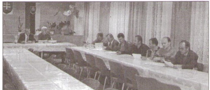
Zo zasadnutia Obecného zastupiteľstva

Druhé zasadnutie OZ sa konalo 31. januára 2003. Schválil sa rokovací poriadok obecného zastupiteľstva, ktorým sa upravujú pravidla, podmienky, spôsob prípravy a priebehu rokovania, prijímania uznesení, všeobecných záväzných nariadení, rozhodnutí spôsobom kontroly ich plnenia a zabezpečovania úloh obecnej