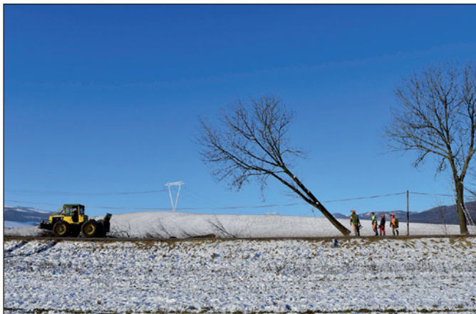
Výrub stromov pri ceste I-66