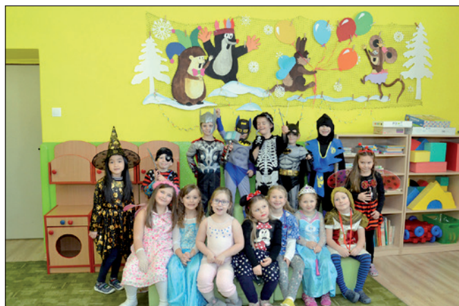
Karneval v MŠ I.