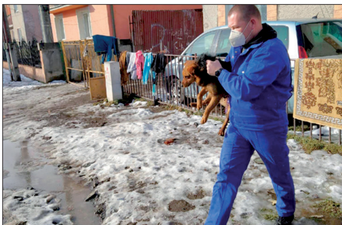
Odchyt psov v obci