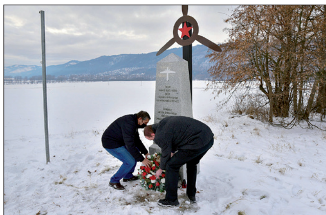
Kladenie vencov pri príležitosti oslobodenia obce