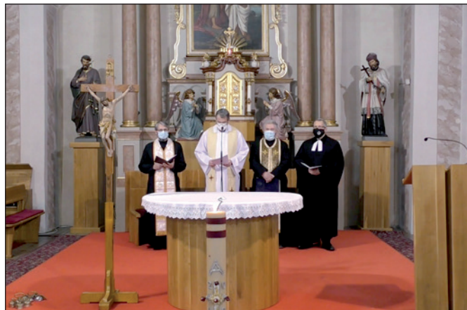
Ekumenický deň 2021