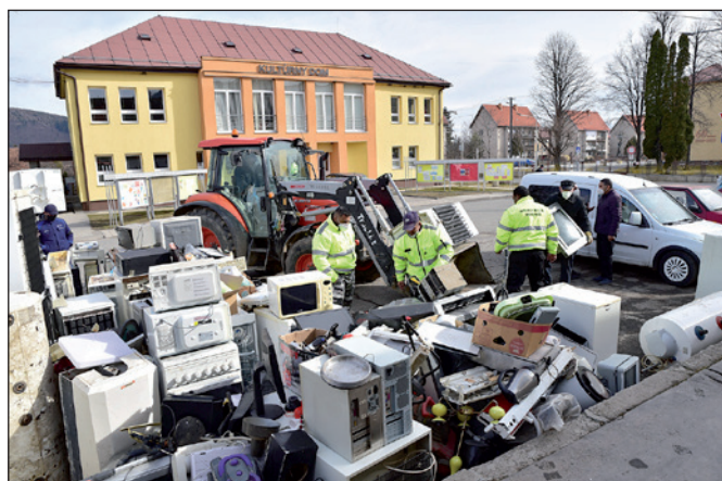
Zber elektroodpadu v obci