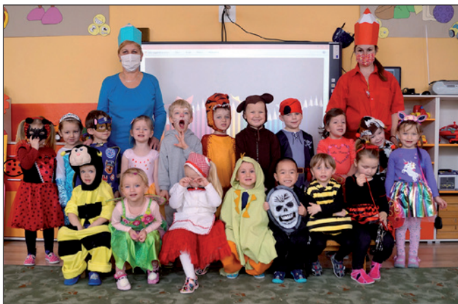
Karneval v MŠ I.