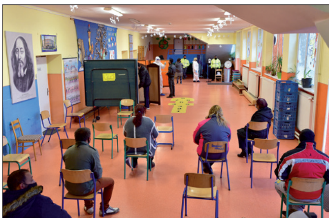
Testovanie obyvateľov na COVID-19