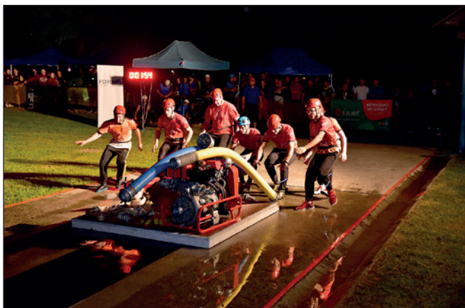
Nočná hasičská súťaž