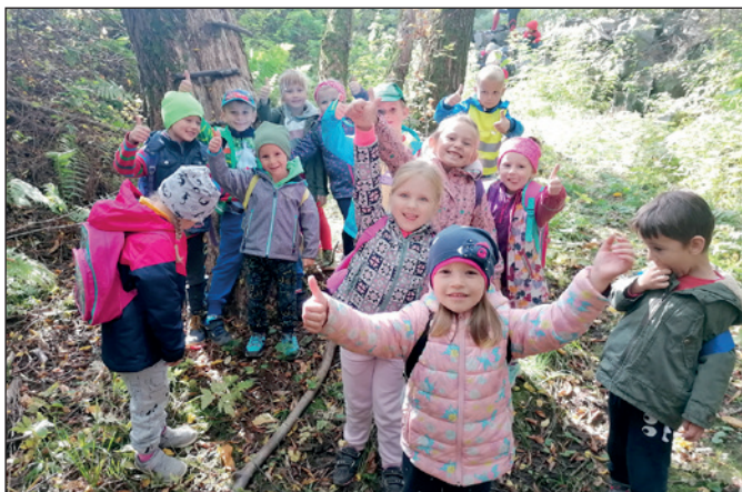
Žiaci MŠ ul. Hviezdoslavova na výlete na Lúčke