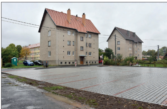
Parkovisko na Budovateľskej ul.