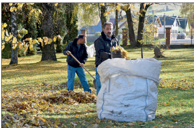
Upratovanie cintorínov pred Dušičkami