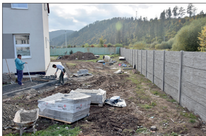
Chodník a oplotenie pri MŠ na ul. SNP