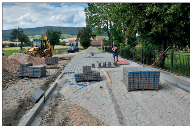
Práce na parkovisku pri cintoríne