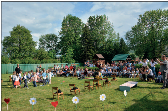
Deň matiek v MŠ I.