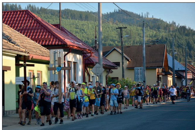
Príchod účastníkov Púte Muráň - Levoča