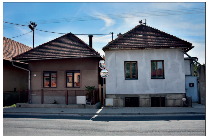
Novoosadené zrkadlá, ktoré sprehľadnia výjazd na hlavnú cestu.

• V najbližšom čase by mala Slovenská správa ciest začať s opravou cestného priepustu na ceste I/66 na vjazde do obce od Vernára. Vzhľadom na poškodenie telesa priepustu je potrebná jeho kompletná výmena. Z tohto dôvodu dôjde k zúženiu cesty na jeden jazdný pruh.