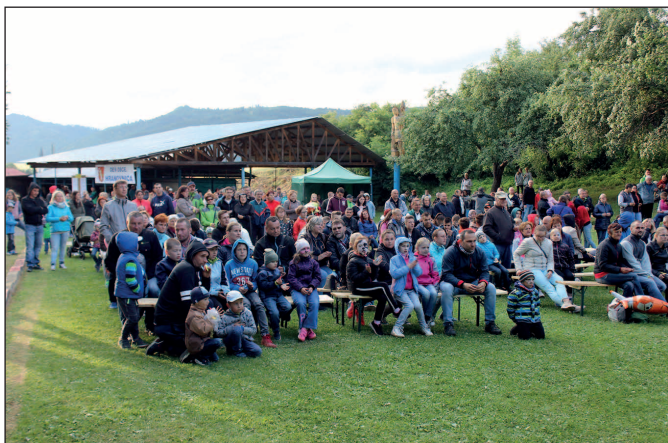
Deň obce Hranovnica