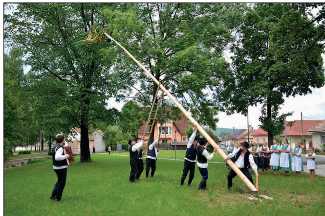
Stavanie obecného mája