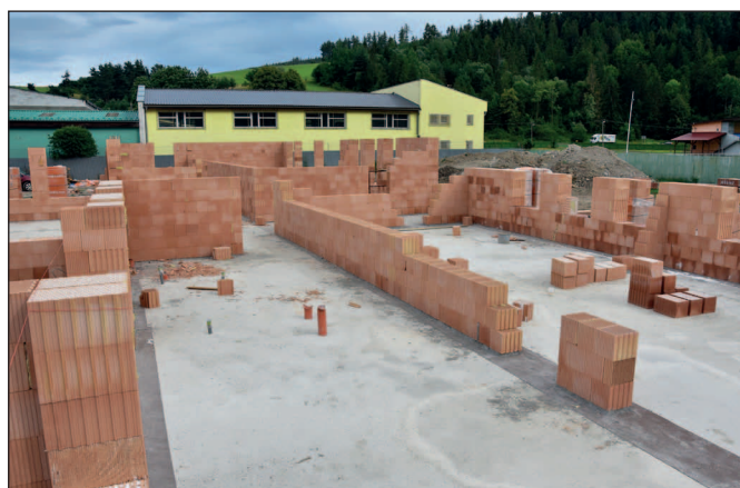
Práce na stavbe MŠ II.