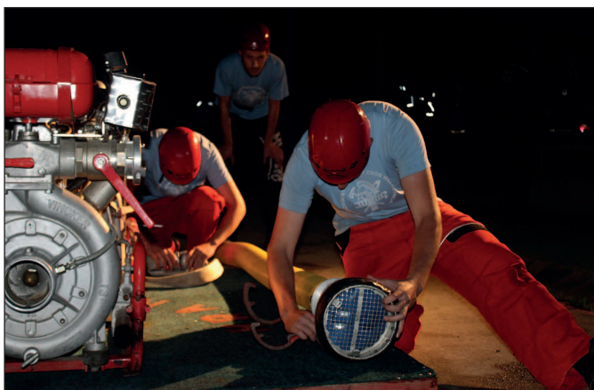
Nočná hasičská súťaž na Lúčke