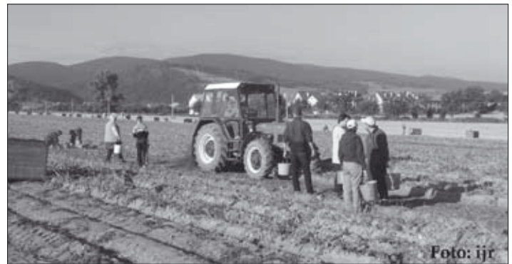
Zo zberom zemiakov sa začalo 6. septembra...