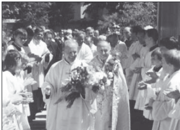
Zo spravodlivého života pramení spokojnosť a radosť....

Myslím si, že mladí ľudia majú v dnešnej dobe omnoho ťažšie podmienky k dobrému mravnému životu. Obrovský pokrok