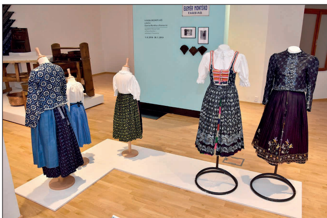
Výstava modrotlačé v podtatranskom múzeu