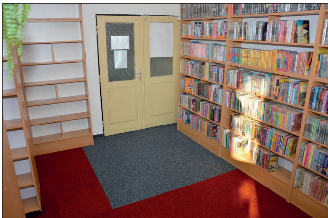
Výmena zariadenia v obecnej knižnici