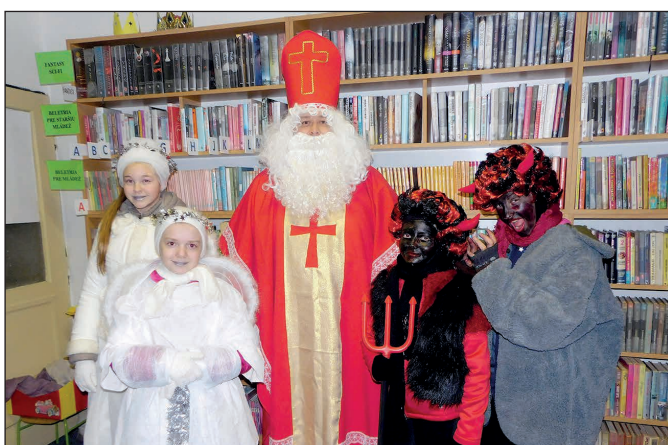
Návšteva Mikuláša v Hranovnici