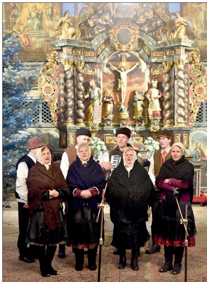
FS Kochman na vystúpení v Kežmarku.