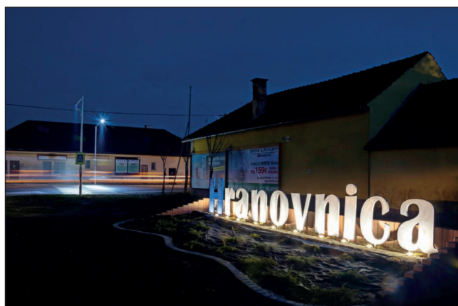
Osvetlenie nápisu Hranovnica