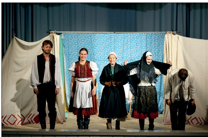
Divadelné predstavenie Zákon žien