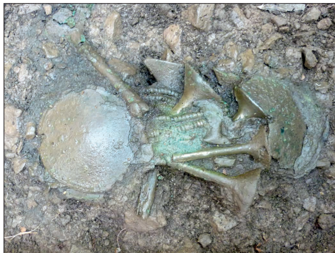
Depot bronzových šperkov

Najkrajším nálezom z výskumu je depot (poklad) bronzových šperkov, ktorý predbežne možno datovať do strednej až mladšej bronzovej doby. Depot bol nájdený v bezprostrednej blízkosti severného konca valu, ale k samotnému opevneniu nemal žiaden stratigrafický vzťah. Poklad pozostával zo šperkov v podobe bronzových špirálok a plechových lievikovitých záveskov. Šperky boli do zeme pravdepodobne uložené v koženom obale, na povrchu kto-