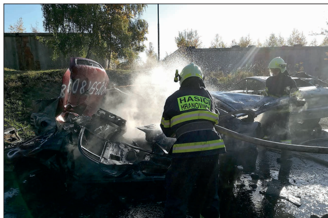
DHZo Hranovnica na výcviku na Lešti