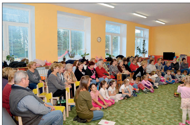
Besiedka so starými rodičmi v MŠ I.