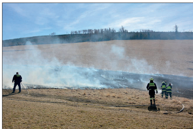
Hasenie požiaru na Babke