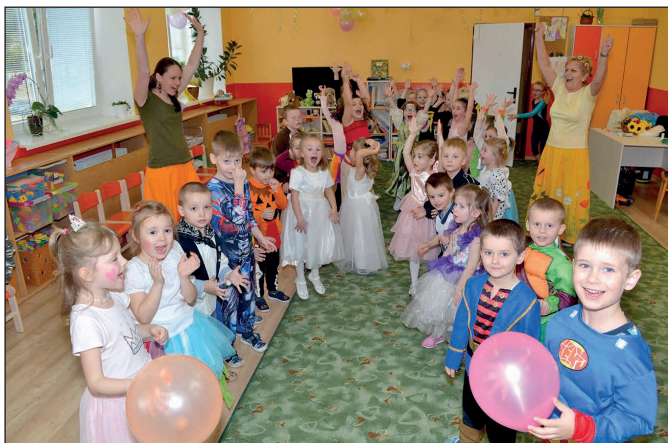
Karneval v MŠ I.