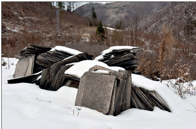
Skládka azbestovej krytiny na Hranovnickom plese