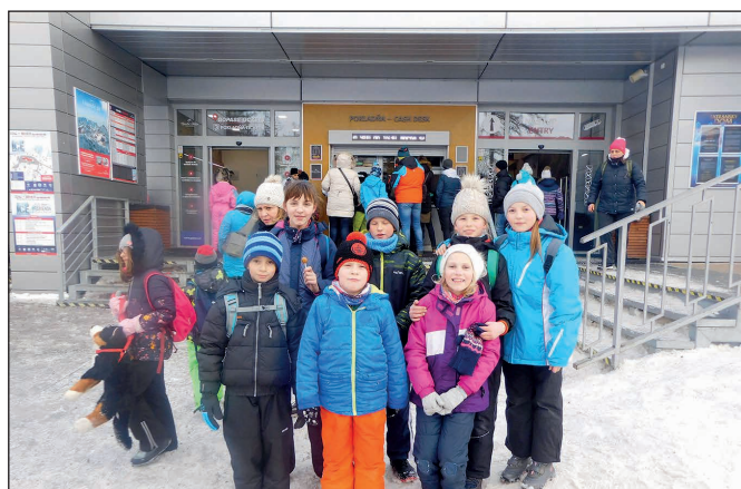
Prázdninový výlet detí na Hrebieňok