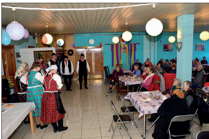
Fašiangové posedenie dôchodcov