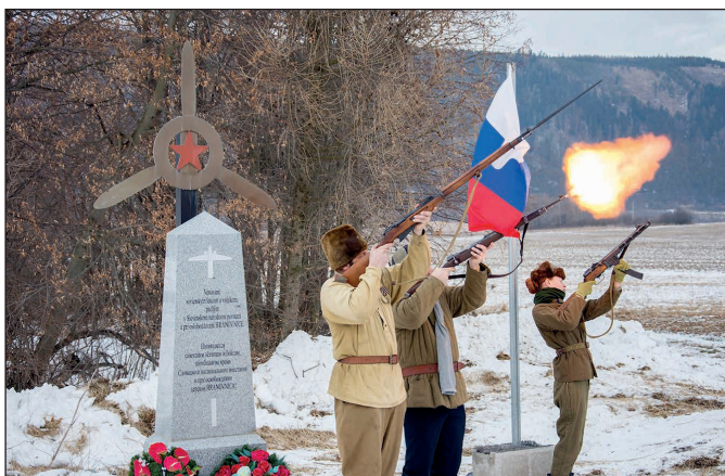
Kladenie vencov na výročie oslobodenia obce