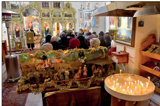
Ekumenický deň 2019