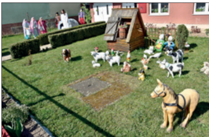
Veľká noc na dvore p. Vallušovej