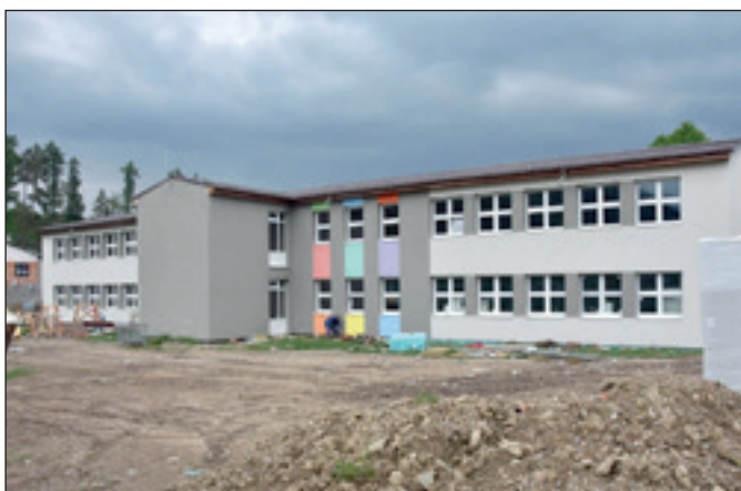
Južná fasáda MŠ II.