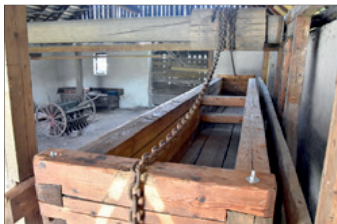
Mangel umiestnený v modrotlačiarскеj dielni