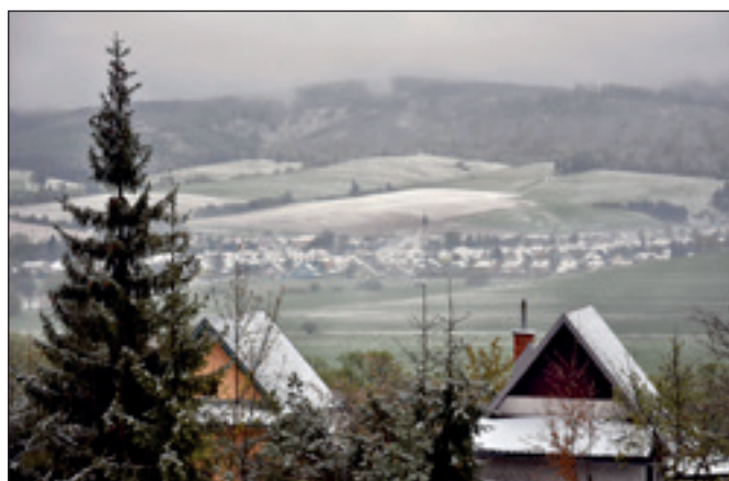
Májový sneh v Hranovnici