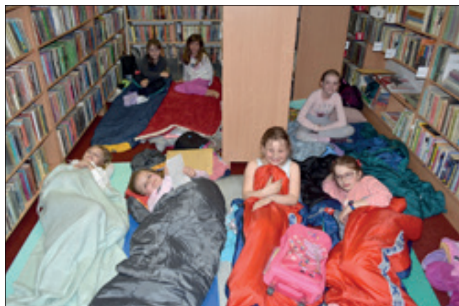
Noc s Andersenom