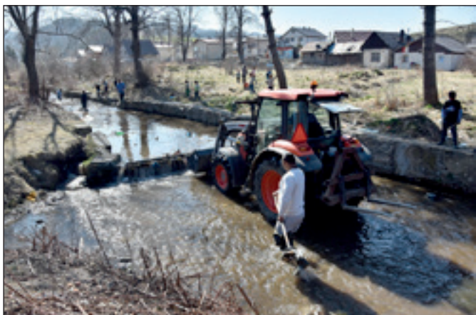
Jarné čistenie Vernárky