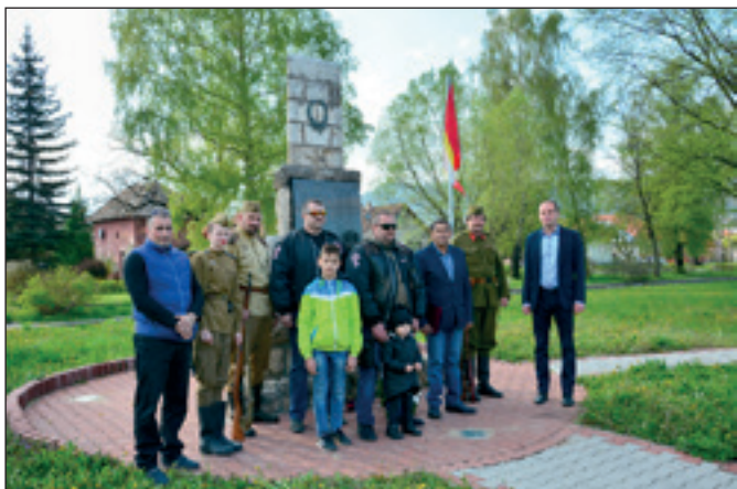
Akt kladenia vencov pri pamätníku I. a II. svetovej vojny