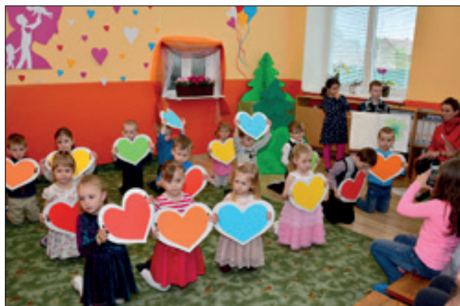
Deň matiek v MŠ I.