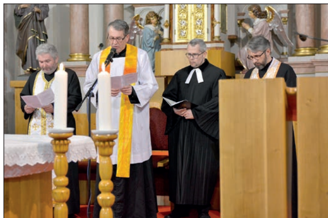
Ekumenický deň 2020