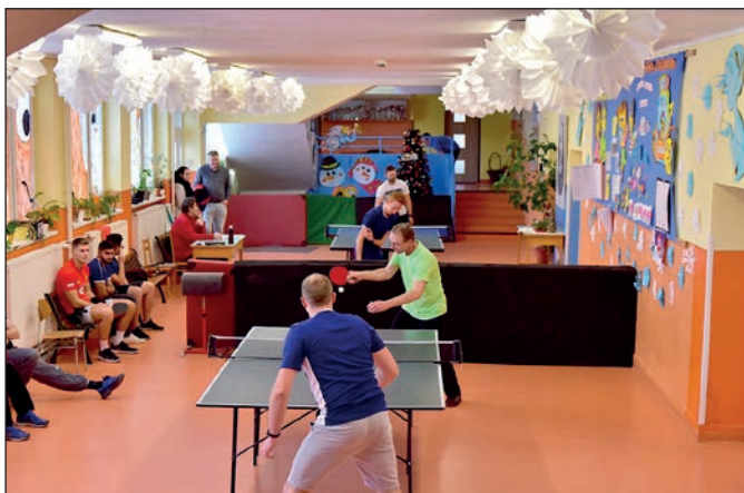
Vianočný stolnotenisový turnaj