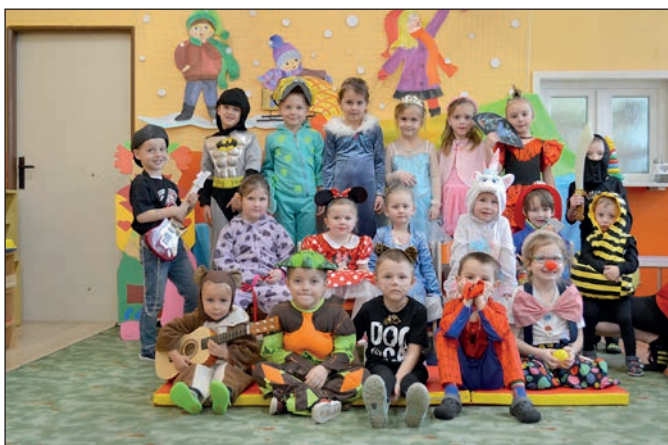
Karneval v MŠ I