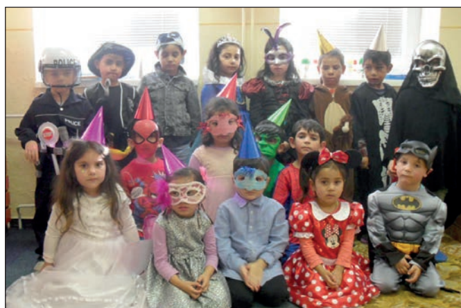
Karneval v MŠ II