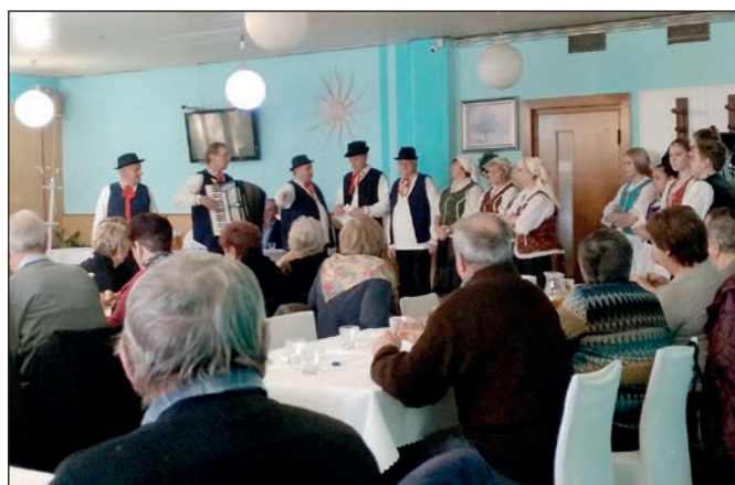
Fašiangové posedenie dôchodcov