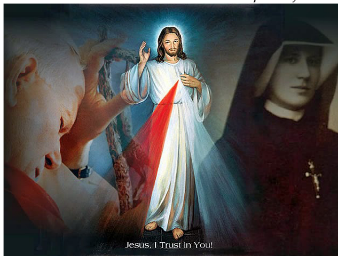
Ilustračná koláž – domenicmarando.blogspot.com