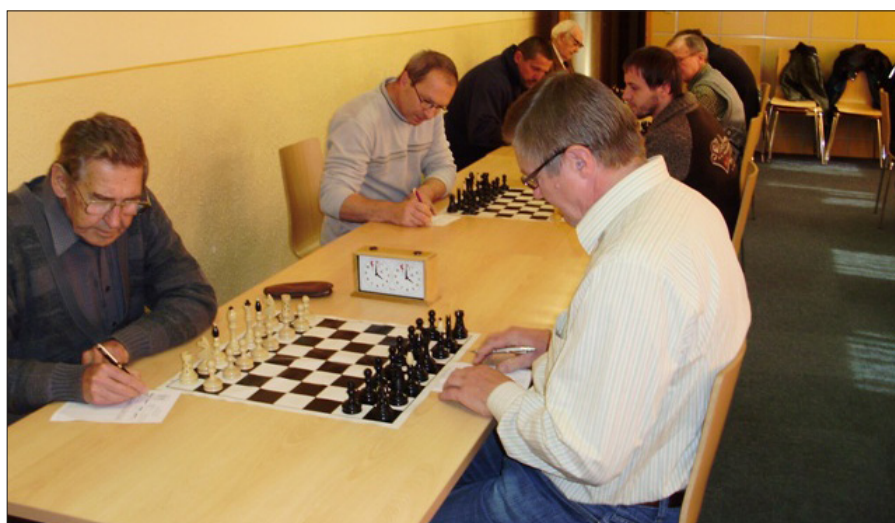
Konečná tabuľka 3. ligy