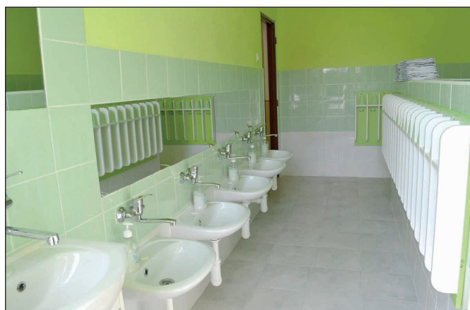
Rekonštrukcia soc. zariadení v MŠ na ul. Hviezdoslavovej