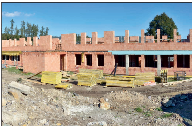
Rozostavaná budova MŠ na ul. SNP