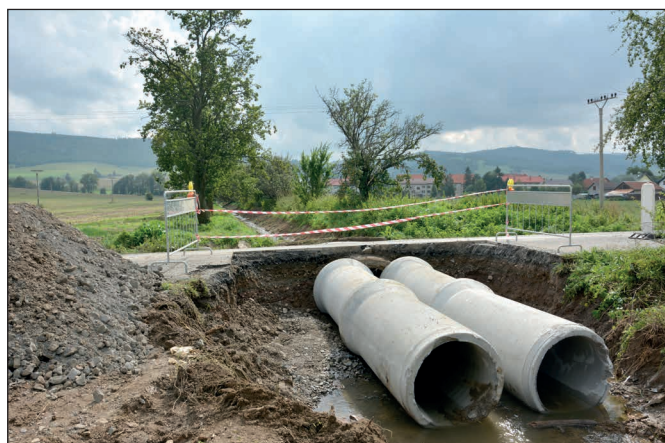
Rozšírenie priepustu na ceste III-3069