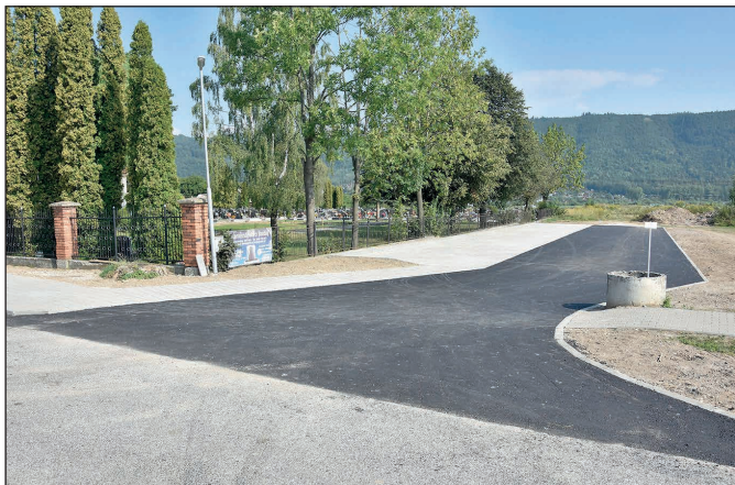
Dokončené parkovisko pri cintoríne