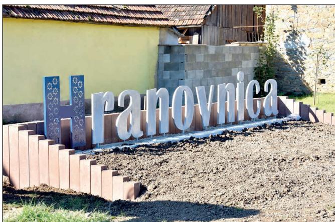
Úprava verejných priestranstiev