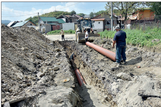
Predĺženie kanalizácie na ul. Hviezdoslavovej