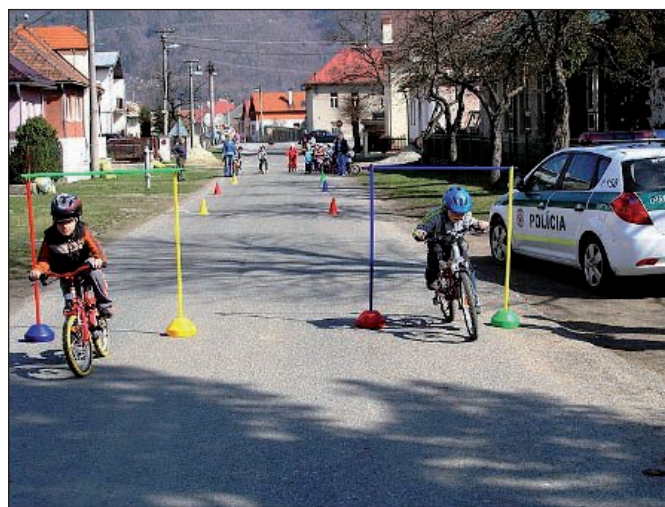
Cyklistické preteky detí materskej školy Bocianík