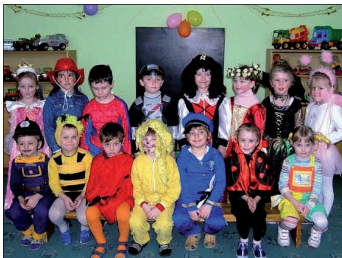
Staršie deti materskej školy na karnevale