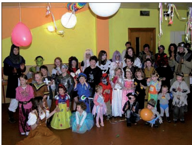
Deti na obecnom karnevale