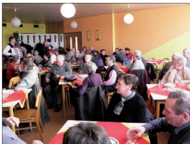
Posedenie dôchodcov na fašiangovom stretnutí