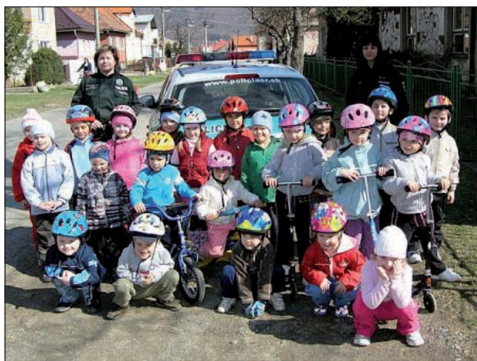
Skupinka detí materskej školy po cyklistických pretekoch