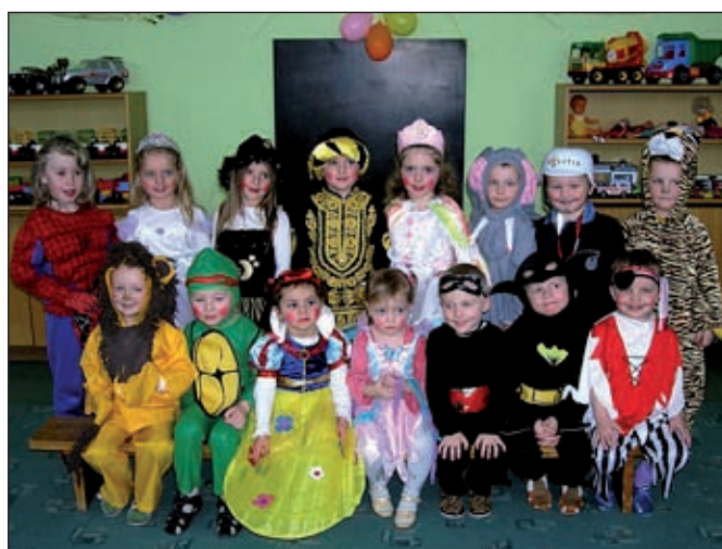
Mladšie deti materskej školy na karnevale