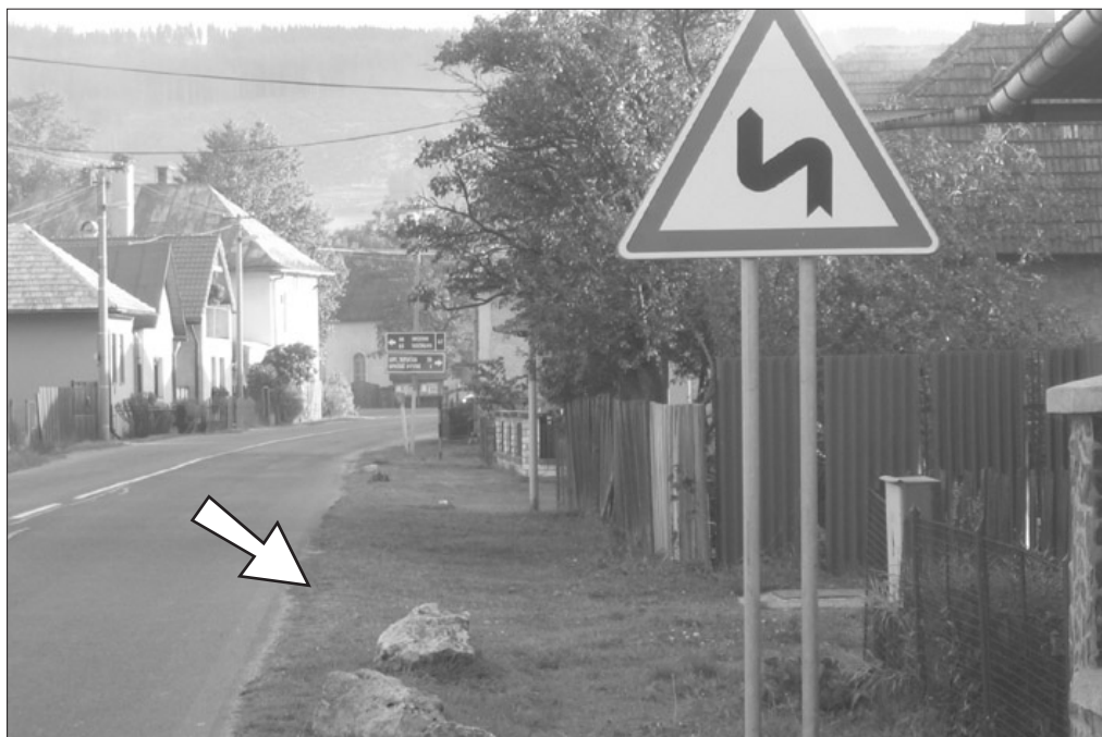
Obchádzaním okrasných kameňov vzniká nebezpečná situácia pre chodcov, ktorí sú nútení pohybovať sa po ceste.

☞ Predám dve protektorované zimné pneumatiky R 170/65 - na diskoch. 0908 056756.