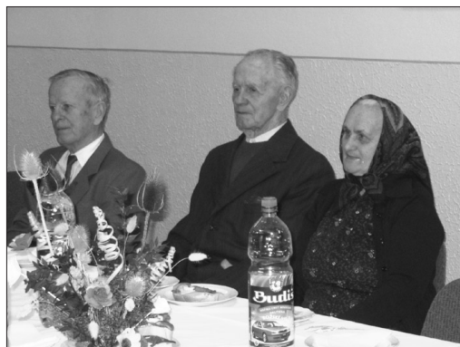
ilustračné foto imb