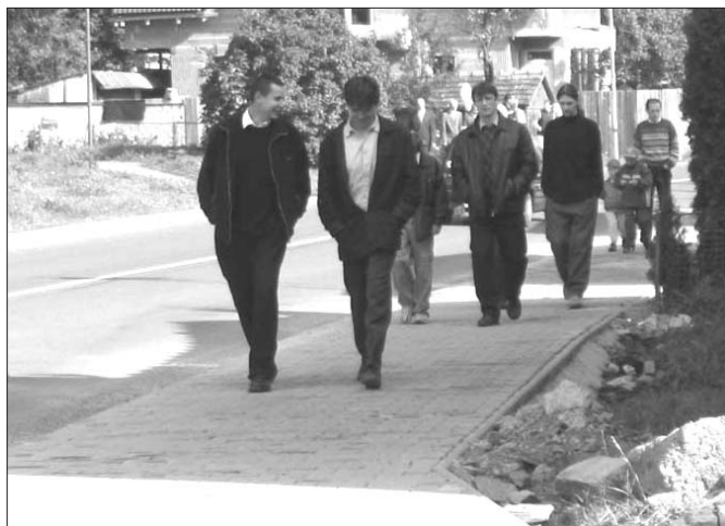
Realizácia chodníkov je jedna z hlavných priorít našej obce...