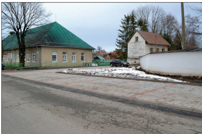
Parkovisko pri Rímskokatolíckom kostole pripravené na prevádzku