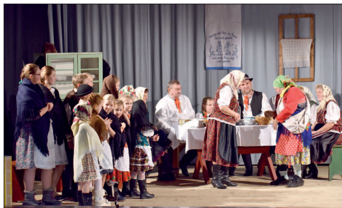
„Sviatky v Hranovnici“ – vianočné predstavenie Folklorneho súboru Kochman