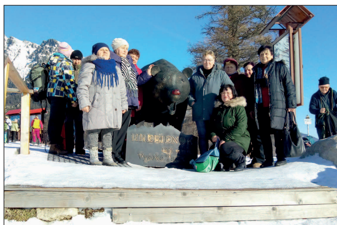
Výlet členov OZ BAPKA na Hrebenku