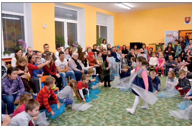
Vianočná besiedka MŠ, ul. Hviezdoslavova