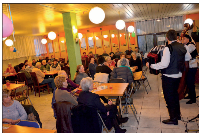
Fasíngové posedenie dôchodcov