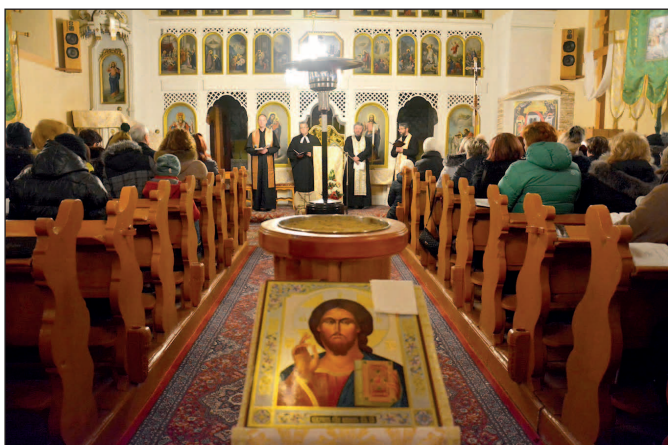
Ekumenický deň 2018