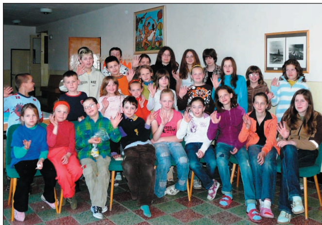
Spoločná fotografia účastníkov Andersenovej noci.