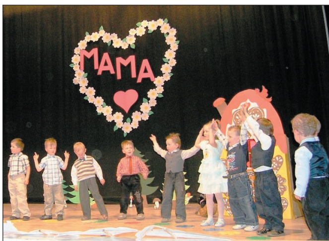
Vystúpenie mladších detí z materskej školy na Deň matiek.