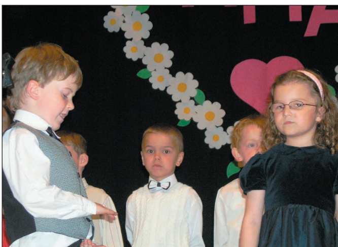
Vystúpenie starších detí z materskej školy na Deň matiek.