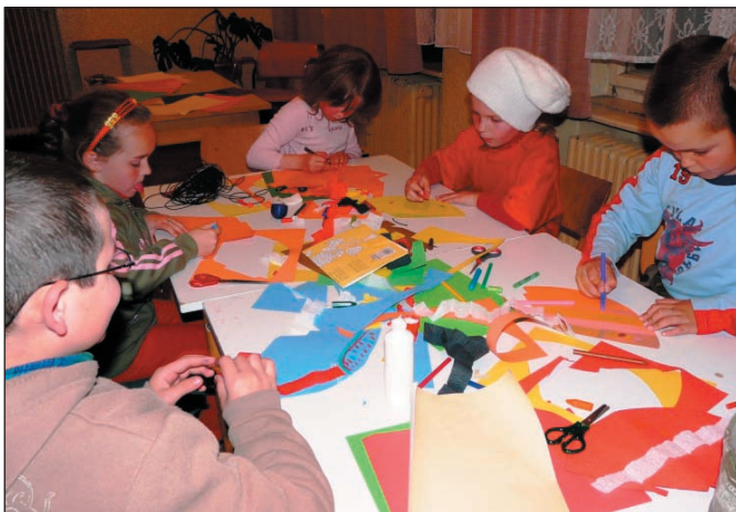
Deti v zaujatí plnenia úloh počas Andersenovej noci.