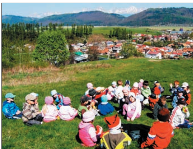
Posedenie detí z materskej školy počas výletu v okolí obce.