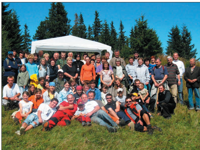
Účastníci šiesteho ročníka Púte Kráľovskou cestou