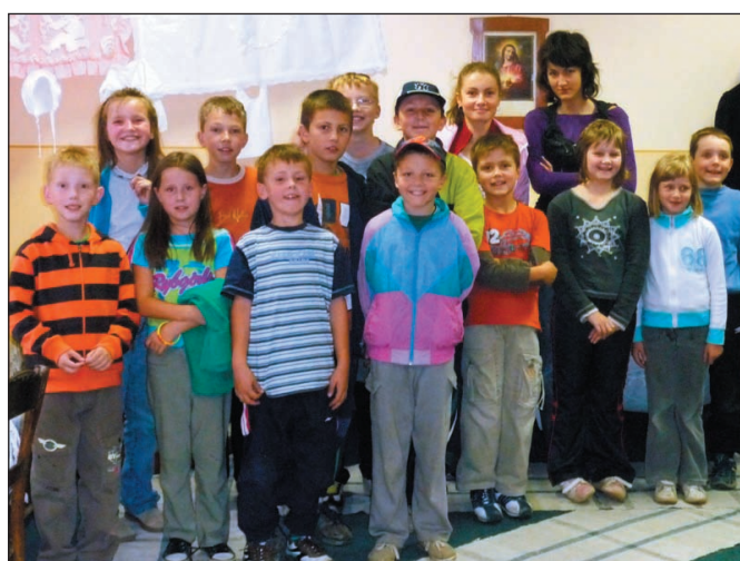
Účastníci turnaja v scrabble „O špijel profesora Štoplca“