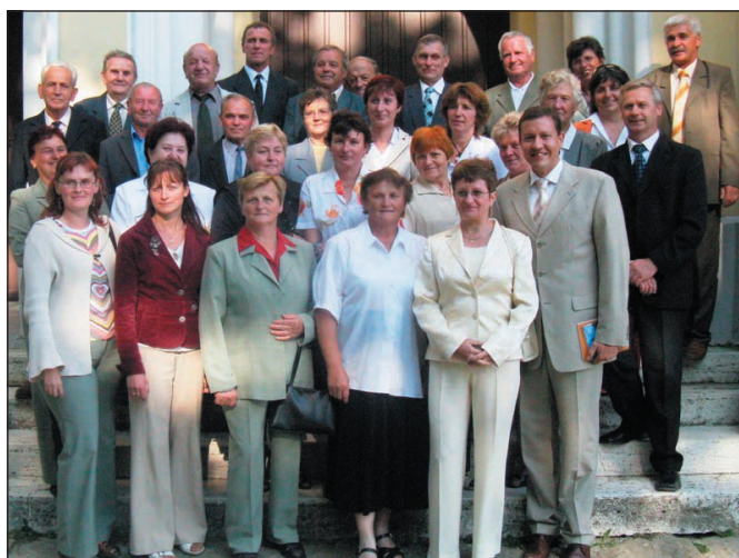
Spevokol s Lipšicom na púti kresťanských demokratov