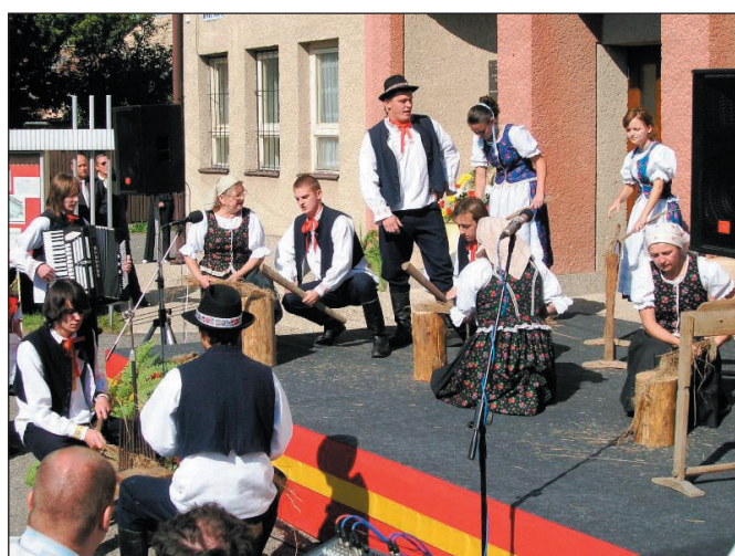
Vystúpenie súboru Lúčka na Spomienkovej slávnosti