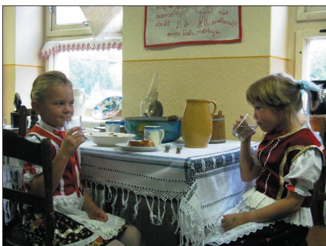
Hranovnica moja – výstava zameraná na obec v minulosti