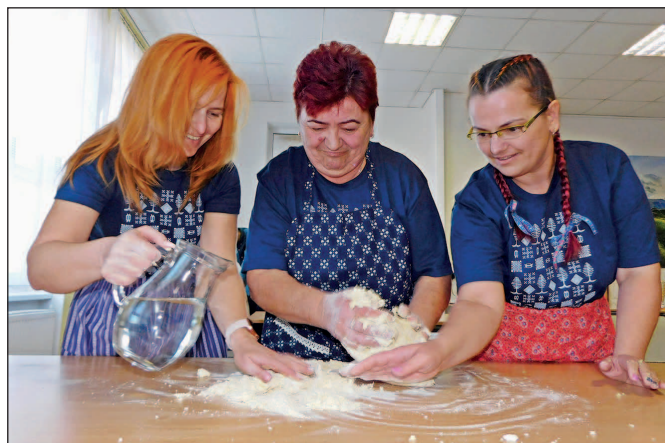
Družstvo Hranovnice na súťaži v šúľaní šúľancov