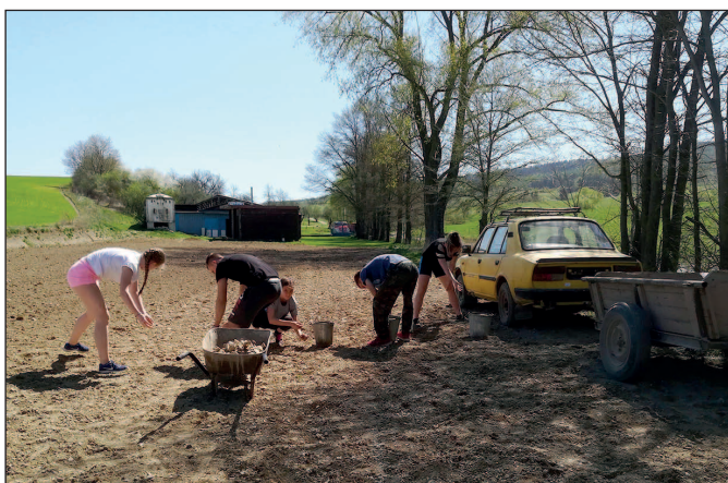
Brigáda DHZ na Lúčke