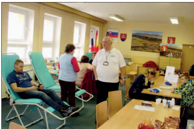
Jarný hromadný odber krvi