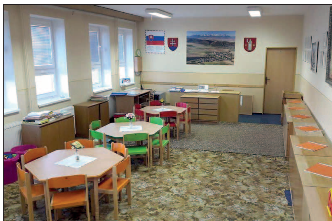
Priestory Klubu obce upravené pre výučbu MŠ II