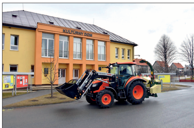
Nový obecný traktor