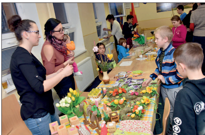
Veľkonočné tvorivé dielne