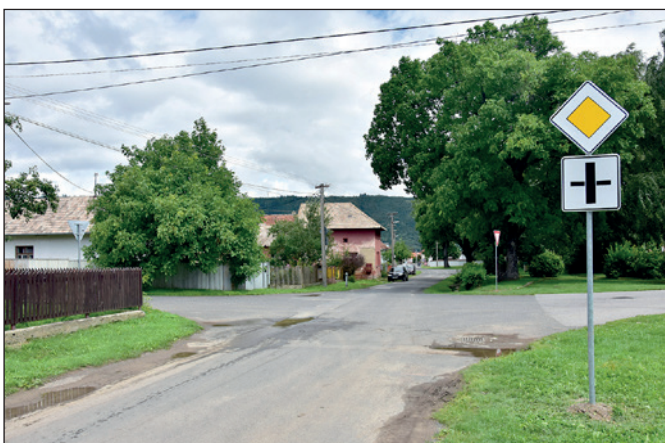
Osadenie dopr. značenia na Hviezdoslavovej ulici