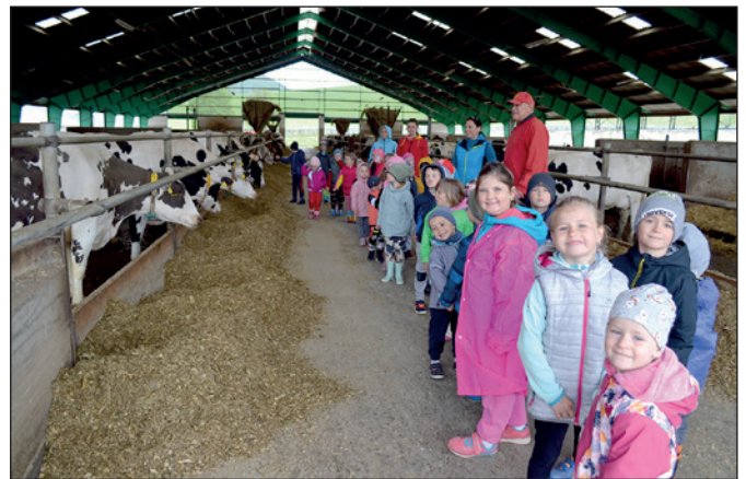
Exkurzia žiakov MŠ I. na polnohosp. družstve