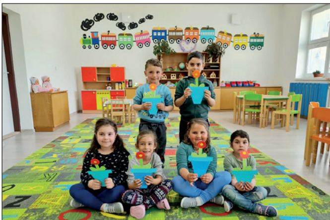
Výroba darov ku Dňu matiek žiakmi MŠ II.