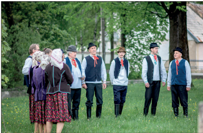
Stavanie mája v parku na ul. SNP