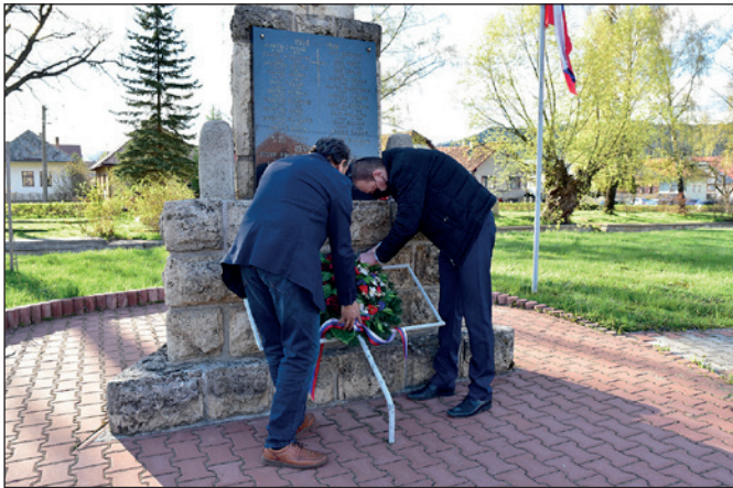
Kladenie vencov pri príležitosti skončenia 2. svetovej vojny