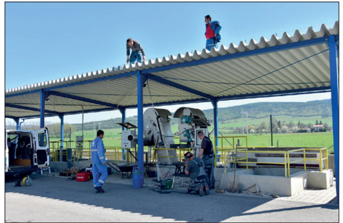
Úprava prítoku ČOV