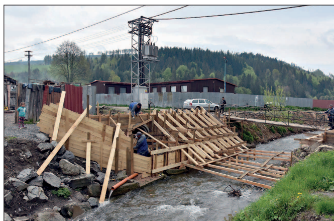
Práce na oprave lavičky cez Vernárku na ul. SNP