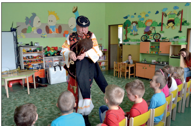
Výchovný koncert v MŠ I.