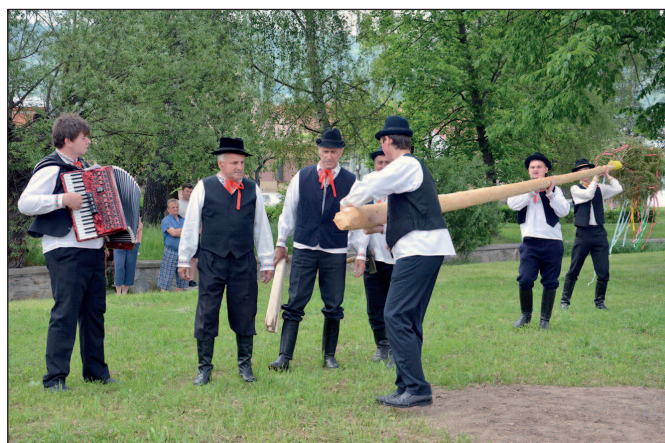
Stavanie obecného mája