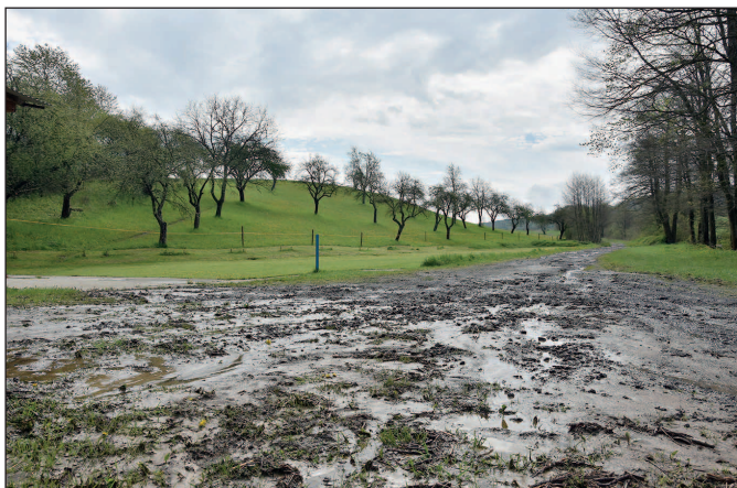
Stav cesty na Lüčke po povodni dňa 12.5.2017