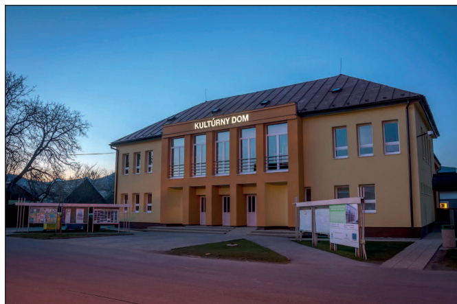
Nočný pohľad na budovu OcÚ a kultúrneho domu