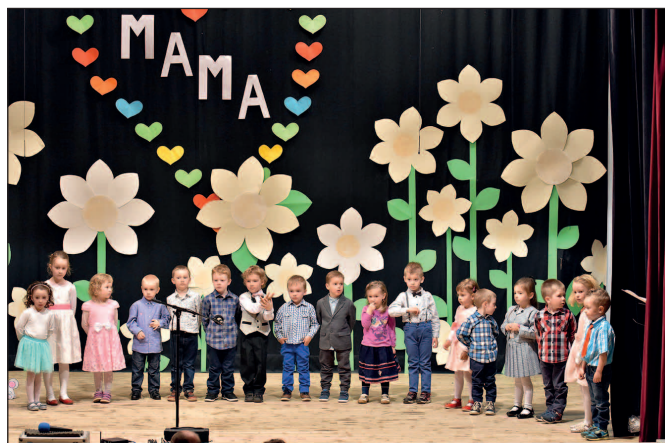
Vystúpenie detí z MŠ I. ku Dňu matiek