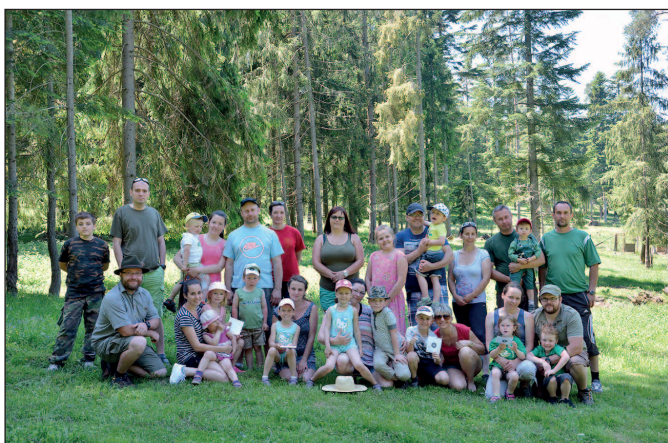
Deň detí s Polovníckym združením Dubina