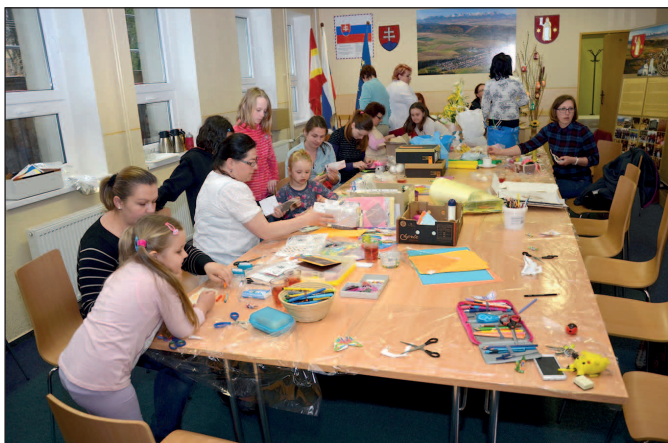
Veľkonočné tvorivé dielne