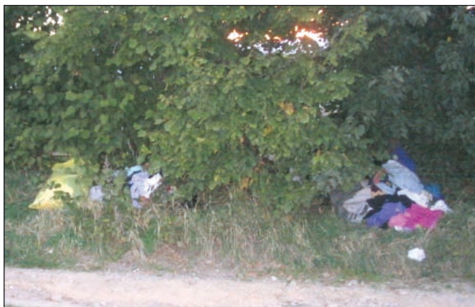
Na zábere vidieť čiernu skládku textilu vytvorenú neďaleko cesty do Spišského Štiavnika na rozhraní chatárov obcí (pri kapličke).

Tieto negatívne javy boli zaznamenávané v malej miere a ani zďaleka neprevyšujú pozitívne prínosy zavedeného množstvového zberu komunálneho odpadu.